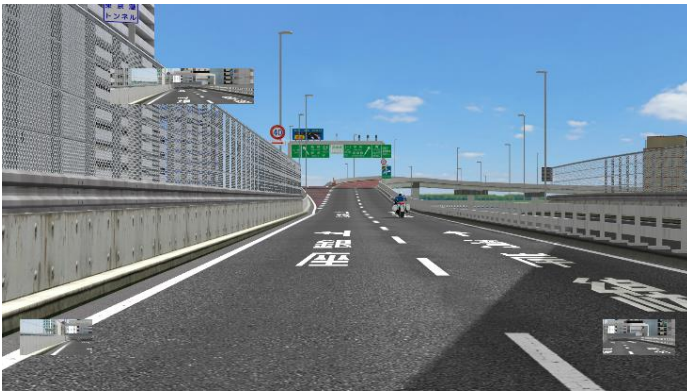
C1 内回り 浜崎橋 JCT