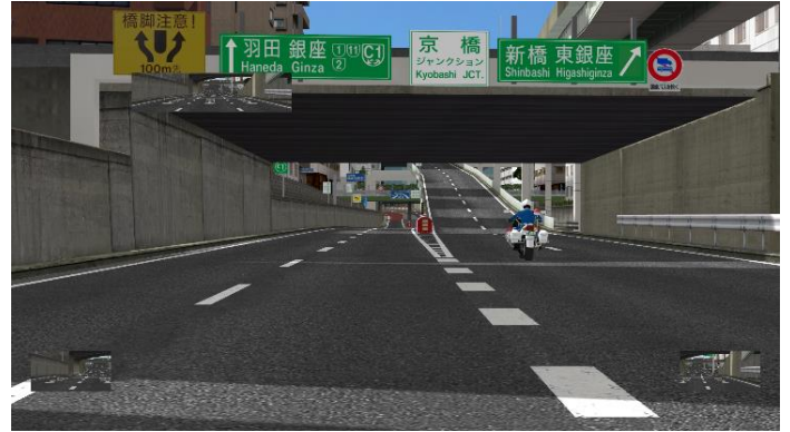
C1 外回り 京橋 JCT