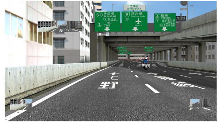
C1 内回り 江戸橋 JCT