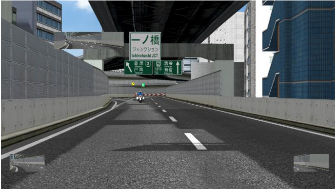
C1 外回り 一ノ橋 JCT